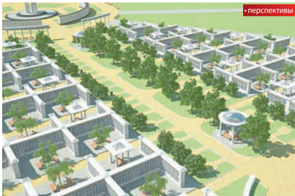
Проект крематория с колумбарием в Перми должен быть реализован в 2014 году

Согласно аукционной документации, участок для строительства кладбища с крематорием будет расположен в районе автотрассы Пермь-Новые Ляды, в районе посёлка Голый Мыс. Его площадь — 48,82 га. Сейчас участок свободен от застройки. Проектом предусматривается строительство кре-