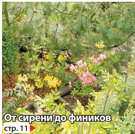
От сирени до фиников стр. 11