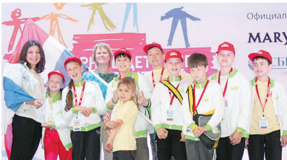
Пермская команда на V Всемирных детских «Играх победителей»

С 19 по 23 июня в Москве прошли V Всемирные детские «Игры победителей» — самые крупные в мире соревнования для детей, перенёвших онкологические заболевания. Идея объединить победивших болезнь детей с помощью спорта возникла несколько лет назад. В 2007 году в Варшаве прошла I Международная онкоолимпиада, в которой приняли участие около 200 детей из разных стран. Россию тогда представляли всего семь юных спортсменов, которые привезли домой три золотые и две бронзовые медали. Участие в онкоолимпиаде стало для детей настоящим праздником. Российский благотворительный фонд «Подари Жизнь» инициировал такие спортивные соревнования и в нашей стране.