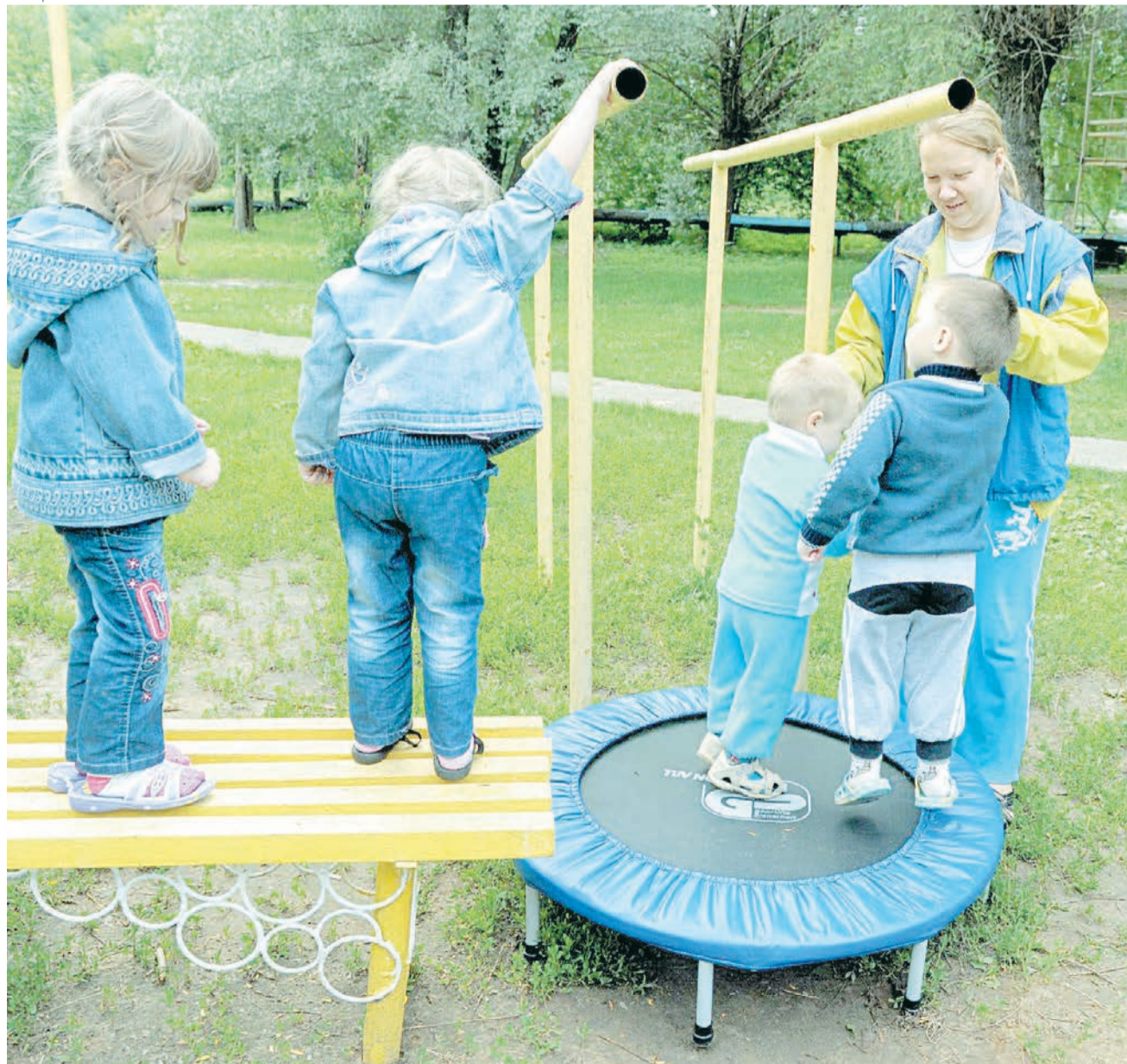
Большинство беженцев, приехавших в Пермь, — женщины и дети