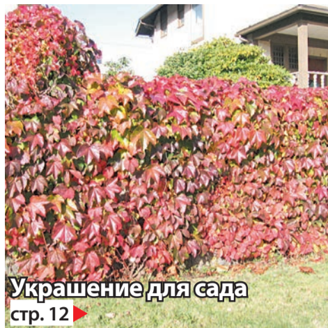
Украшение для сада стр. 12