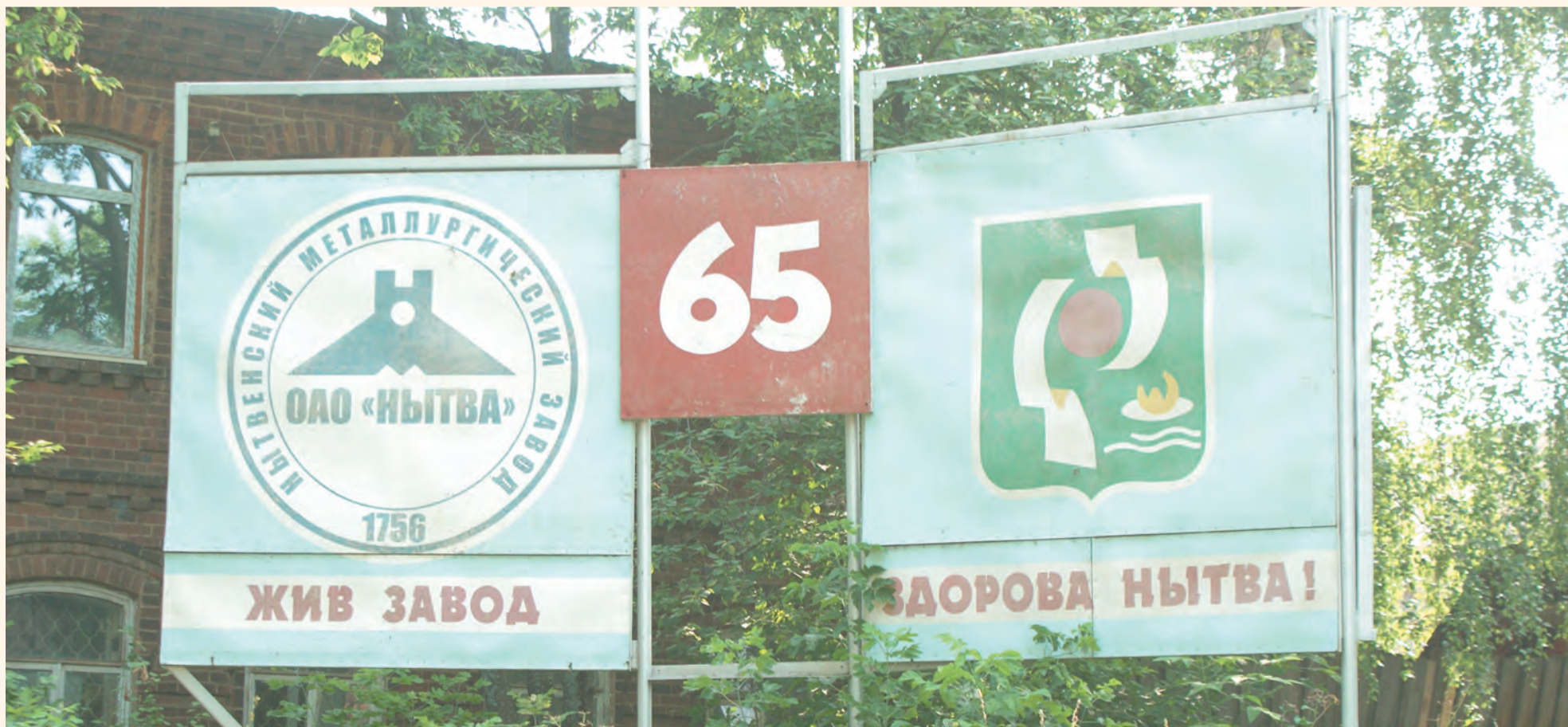
Поселения изначально создавались ради того, чтобы существовал завод, которому подчинялась вся логика жизни территории

«Эта вера совершенно скрадывает давление «вертикали», о котором многие говорят. Многие главы администраций очень уважают своих губернаторов и делают всё для того, чтобы губернатор был ими доволен. На самом деле это — не подчинение. Это отнесение себя к одной команде. Это уважение к региональной власти. Поэтому я бы не спешила всё описывать в терминах подчинения. Ситуация доминирования существует, но интерпретируется она по-разному», — делает заключение Алла Чирикова.