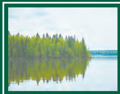
Берег реки Чусовой