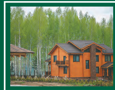
Безопасность и комфорт