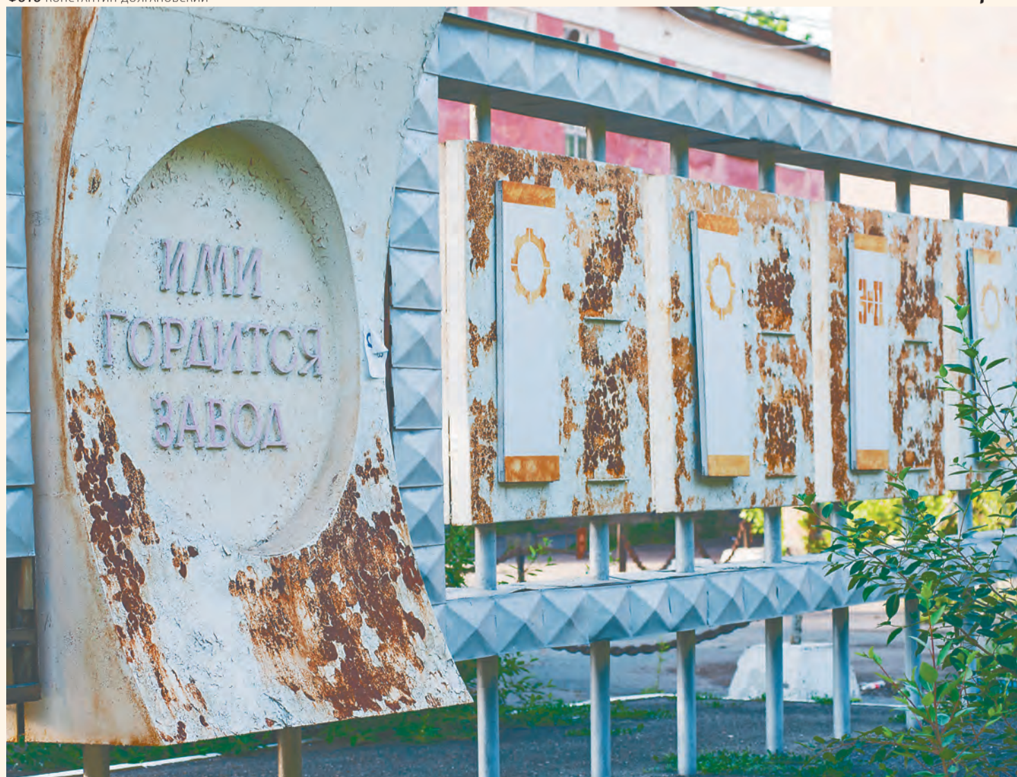
Завод предоставил следственным органам дополнительные материалы по делу и схемы вывода активов