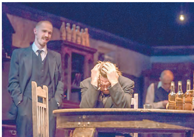
«Сиротливый Запад», театр «Старый дом», Новосибирск