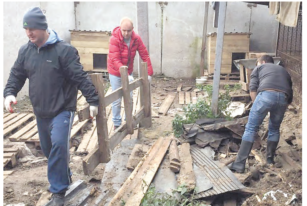
Субботник в муниципальном приюте для животных

«Ежедневно сюда выходит около десятка волонтеров, занимающихся выгулом собак и их кормлением, мы собираем пищу для животных, ремонтируем воль-