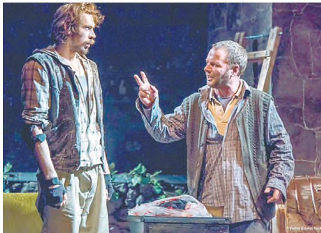
«Лейтенант с Инишмора», театр «У Моста», Пермь

и их обсуждениями на дискуссионных клубах с режиссёрами и членами жюри, лекциями и мастер-классами. Так, например, театровед и научный редактор российского издания книги «Театр и фильмы Мартина МакДонаха» Вера Шамина рассказывала об английской театральной жизни 90-х, а актёры азербайджанского ТЮЗа делились впечатлениями от постановки пьес знаменитого ирландца.