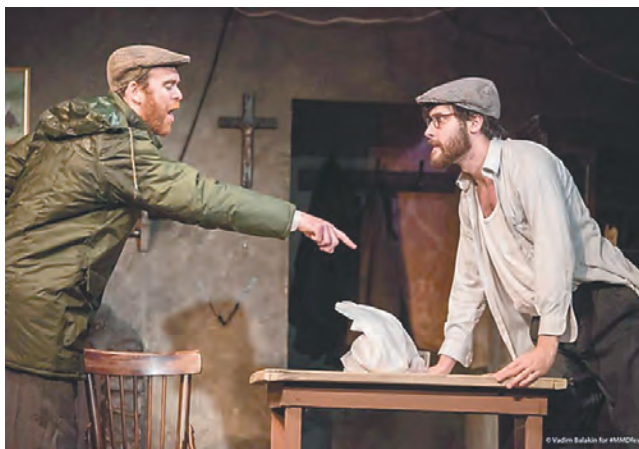
«Сиротливый Запад», Tron Theatre, Шотландия

По сценарию организаторов II Международный фестиваль Мартина МакДонаха формально закончился 7 октября, но артисты, режиссёры, критики и, конечно, зрители будут вспоминать его минимум два года — ровно до следующего, уже третьего фестиваля.