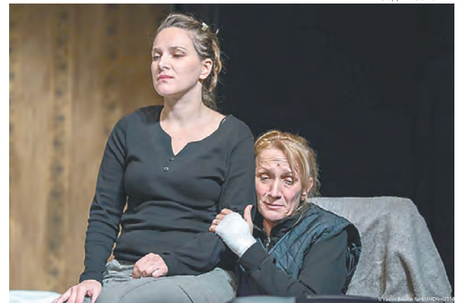
«Королева красоты», Черногорский национальный театр (Montenegrin National Theatre), Черногория

Это почувствовал коллектив Тамбовтеатра. Они по-