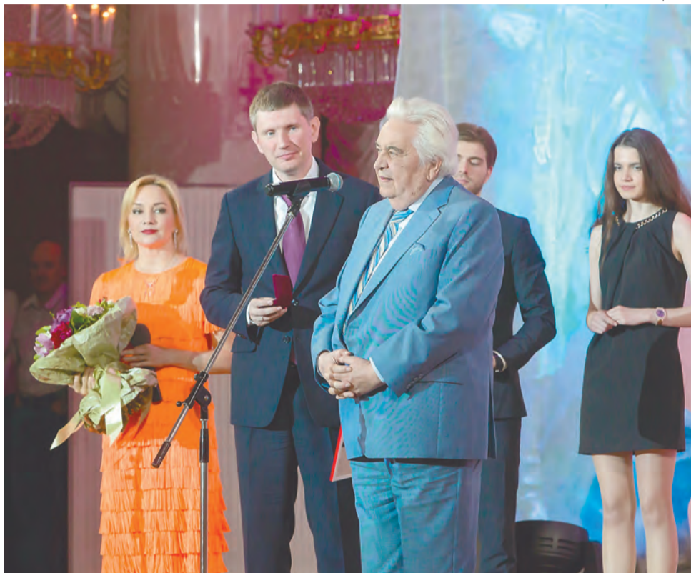
Максим Решетников поздравляет лауреата Строгановской премии Евгения Крылатова