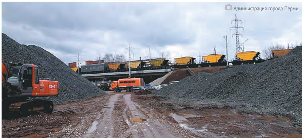
Первое переключение движения поездов на новом путепровode 29 апреля

После переключения движения поездов на новый путепровод и разборки старого подрядчики проведут расширение дороги до шести полос движения: по три в каждую сторону, с разделительной полосой между ними. Ширина каждой обособленной проезжей части на пересечении с новым путепроводом составит 12 метров. Работы будут проводиться по заказу МКУ «Пермблагаустройство».