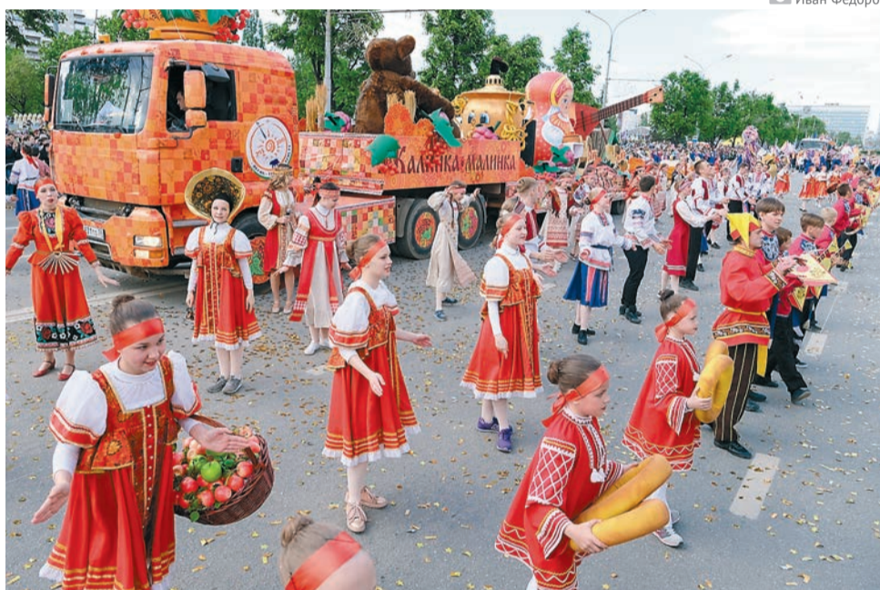
Яркие краски прошлогоднего празднования Дня города

жизни, внесшим весомый вклад в развитие родного города. Завершит мероприятие шоу барабанщиков.