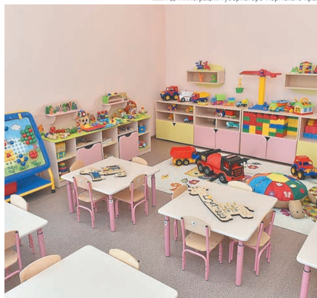
Администрация губернатора Пермского края