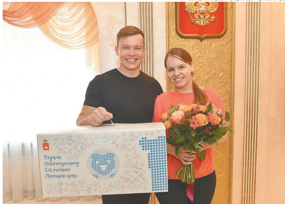
1 июня в Пермском крае вручили подарки первым 370 семьям, в которых с начала этого года родились малыши

Новый детский сад готов принять 16 групп: в двухэтажном здании расположились пищеблок, медицинский кабинет, спортивный и музыкальный залы, кабинеты узких специалистов, подсобные помещения. Общая площадь «Акварельки» составляет более 5 тыс. кв. м. Специфика детского сада —