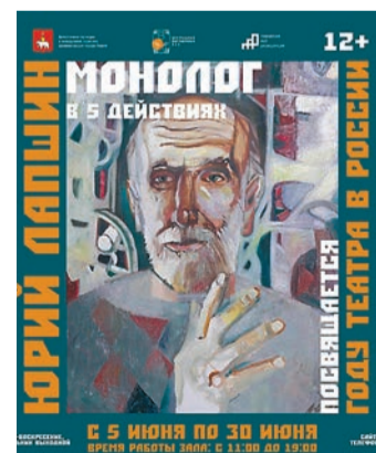
Центральный выставочный зал, до 30 июня