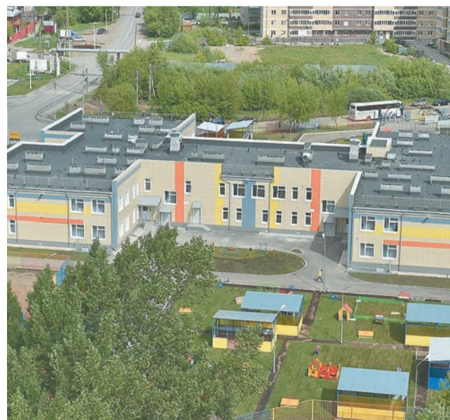
Детский сад в Кондратово

Перед многими кабинетами на стенах висят красиво оформленные информационные стенды, где родители, к примеру, смогут познакомиться с советами доктора,