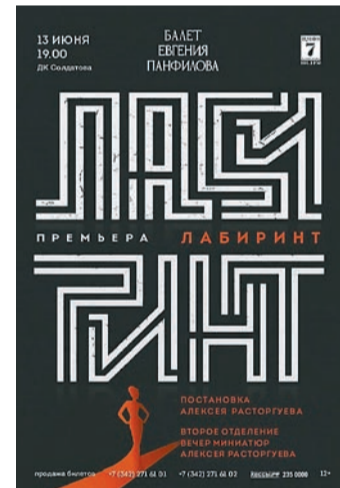
Дворец культуры им. Солдатов, 13 июня, 19:00

AurA Grand Hall (ул. Куйбышева, 66), 14 июня, 19:00