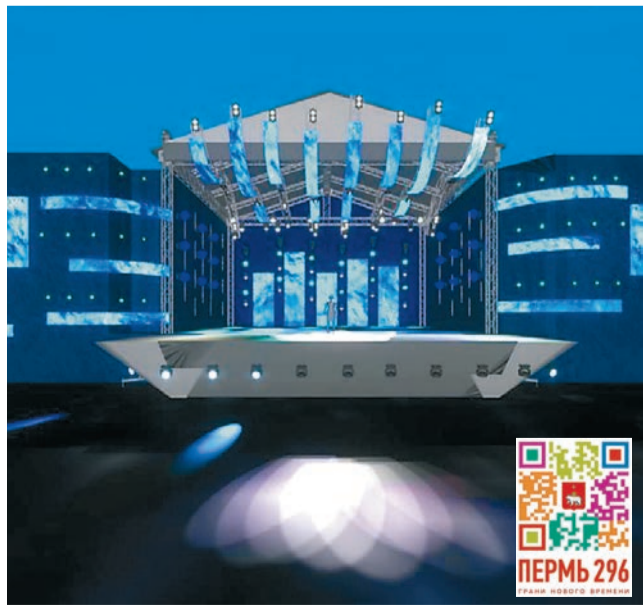
Главная сцена перед Театром-Театром будет оформлена в стиле тематики «Кама-река»