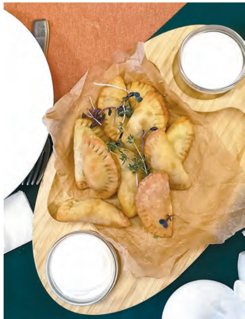
Посикунчики — самый раскрученный кулинарный бренд Пермского края