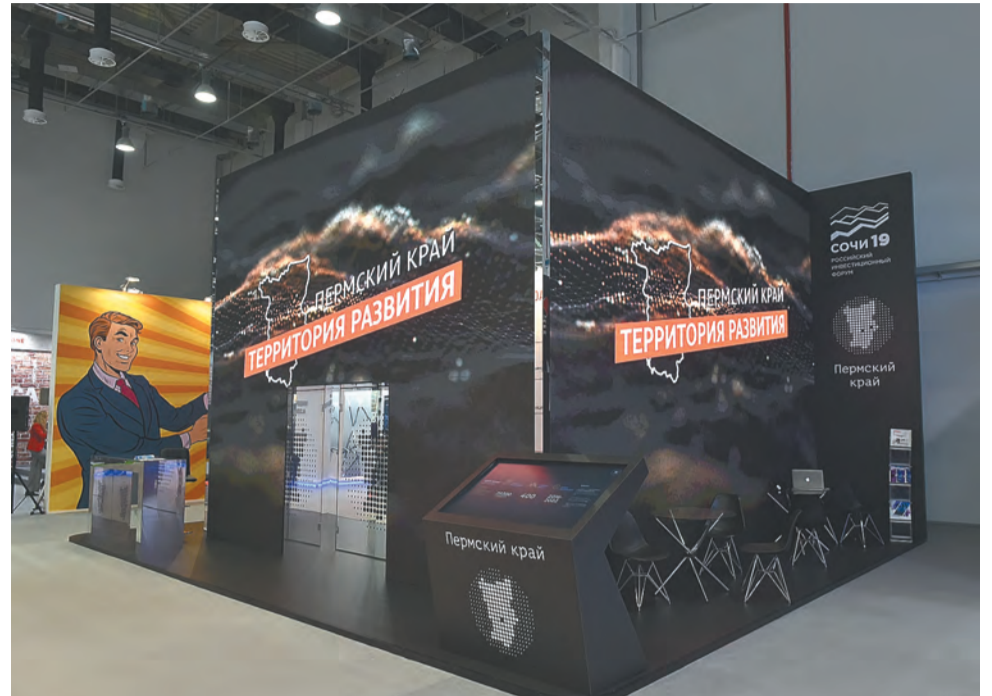
В минэке говорят, что потенциал для развития у региональной экономики есть. Так, в 2019 году Пермский край вошёл в топ-15 регионов РФ по объёму экспорта