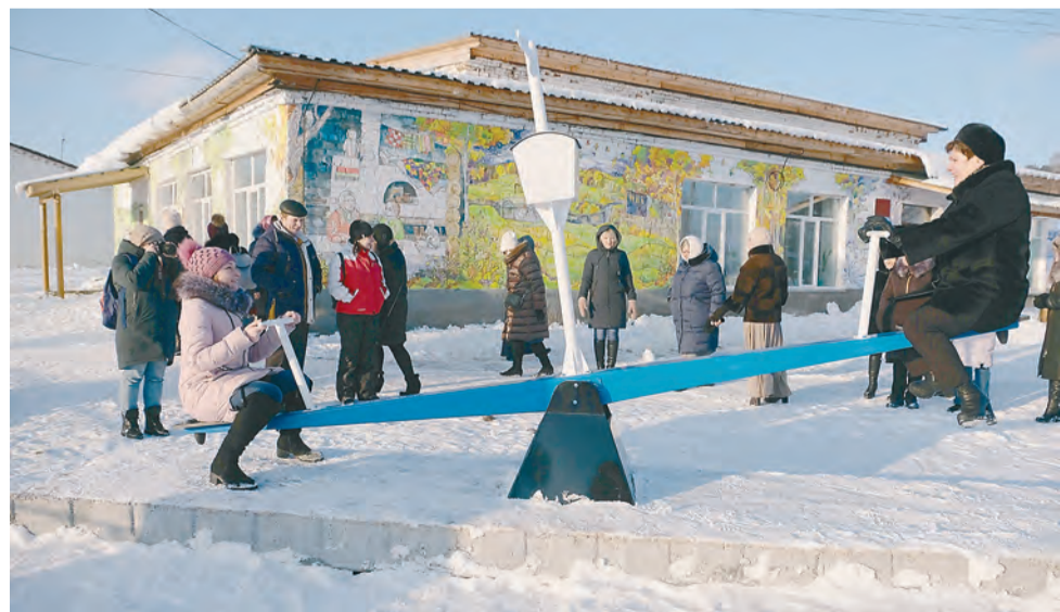
«Говорящие» качели в селе Посад на фоне клуба, украшенного иллюстрациями к сказкам Ольги Арматынской