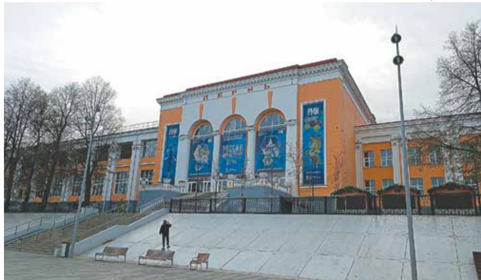
Вокзал займёт первый этаж центральной части здания на ул. Монастырской, 2