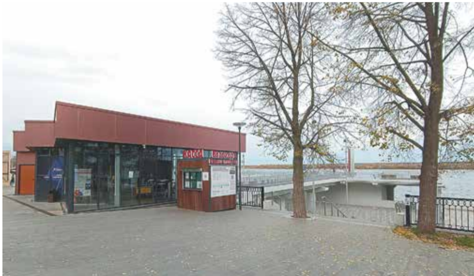
Сейчас кассы для пассажиров речных судов в Перми расположены в киосках