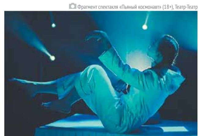
Фрагмент спектакля «Пьяный космонавт» (18+), Театр-Театр

Ранее «МОНОfest» проводился в мае. В прошлом году он стал последним фестивалем автора этого