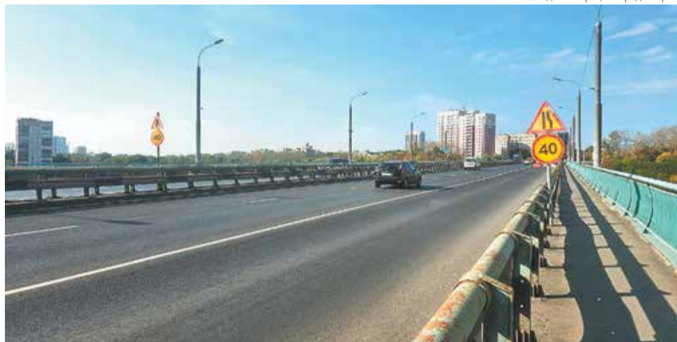
Ремонт проезжей части проведён в августе 2024 года

Ранее губернатор Пермского края Дмитрий Махонин подчёркивал, что федеральная программа «Мосты и путепроводы» нацпроекта имеет большое значение для содержания в нормативном