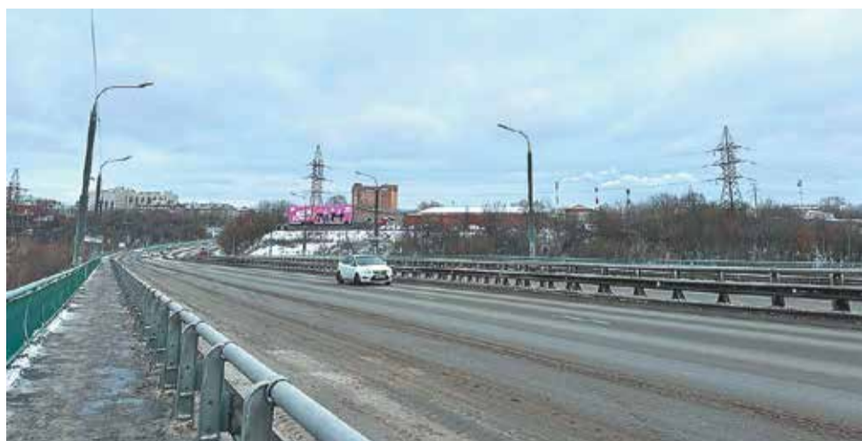
Замена барьерного ограждения закончена в ноябре

состоянии дорожной сети региона, в том числе в части снижения аварийности.