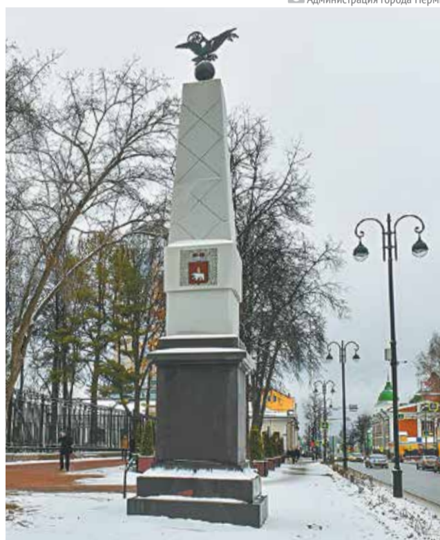
Администрация города Перми

На этой неделе в рамках капитального ремонта улицы завершились работы по установке двух памятных знаков «Сибирская застава», расположенных у входа